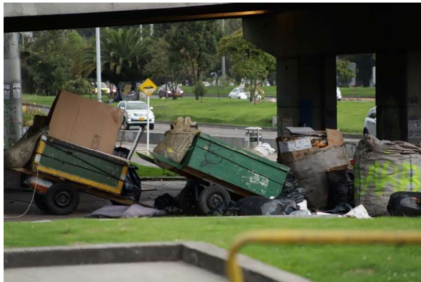
Ilustración 2. Punto Pernoctación carreteros

Puntos de pernoctación de recicladores en espacio Público. Lugares de la ciudad en los cuales, se presenta concentración de población recicladora a fin de desarrollar las actividades de clasificación de material aprovechable, que utilice carretas o zorros, como medio de transporte.